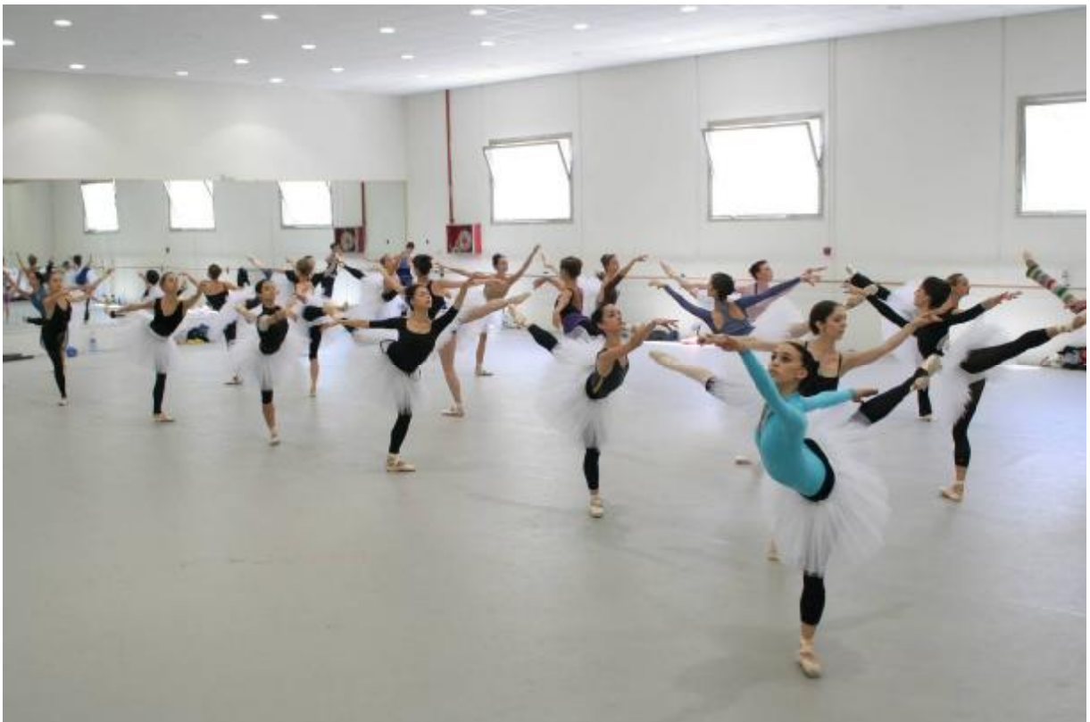
Corella Ballet. Ensayos.

La aspiración es que, a través del trabajo que está realizando, el Corella Ballet se posicione entre las grandes compañías del mundo: como El Royal Ballet de Londres; El American Ballet Theatre de Nueva York; La Ópera de París o La Scala de Milán.