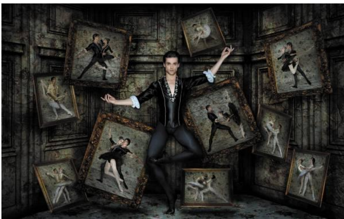
Ángel Corella y Cía en String Sextet.